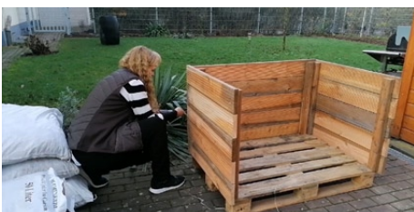
4a. Aufstellen vom zweiten Kopfteil