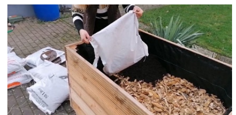
6c. Befüllung mit Kompost