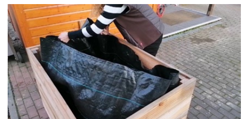
5. Befestigung vom Vlies