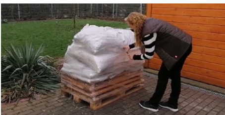
1. Auspacken der Palette