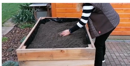
7. Ihr fertiges meinbeethoch3

WIR WÜNSCHEN IHNEN VIEL FREUDE MIT IHREM NEUEN MEINBEETHOCH3 UND STEHEN IHNEN BEI FRAGEN GERNE ZUR VERFÜGUNG!