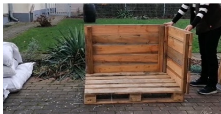
2. Aufstellen der Wände