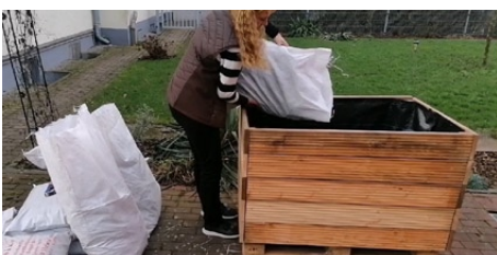
6a. Wurzelbruch ins Hochbeet füllen