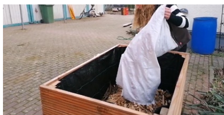
6b. Befüllen mit Hackschnitzeln