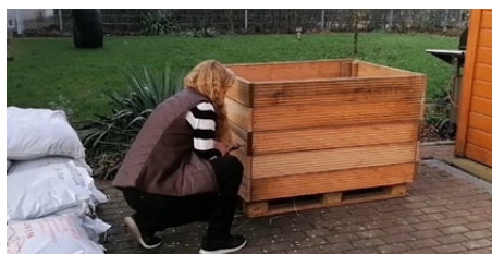
4b. Aufstellen vom zweiten Seitenteil